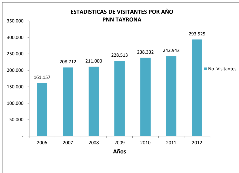
Gráfica No. 2. Estadísticas de Visitantes por año PNN Tayrona