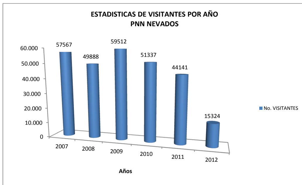
Gráfica No. 4. Estadísticas de Visitantes por año PNN Los Nevados